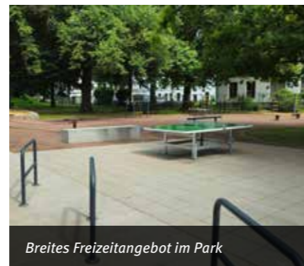
Breites Freizeitangebot im Park

Die Stadt Kassel plante die Entwicklung und Aufwertung des Freiraumes zwischen Frankfurter Straße und B3 als Park Schönfeld Ost und erkennbaren Teil des historischen Park Schönfeld.