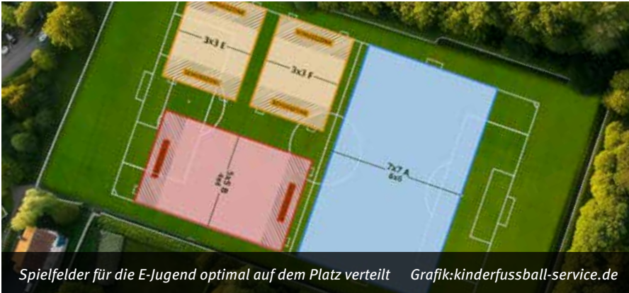
Spielfelder für die E-Jugend optimal auf dem Platz verteilt Grafik:kinderfussball-service.de

Der DFB will mit den neuen Spielformen ab der Saison 2024/2025 im Kinderfußball „mehr Spaß, weniger Leistungsdruck und einen besseren Schutz der Gesundheit“ ermöglichen.