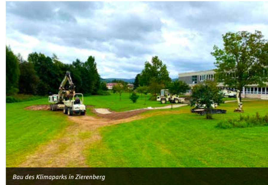
Bau des Klimaparks in Zierenberg