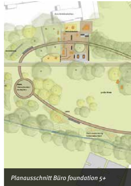
Planausschnitt Büro foundation 5+