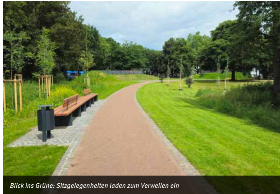
Blick ins Grüne: Sitzgelegenheiten laden zum Verweilen ein