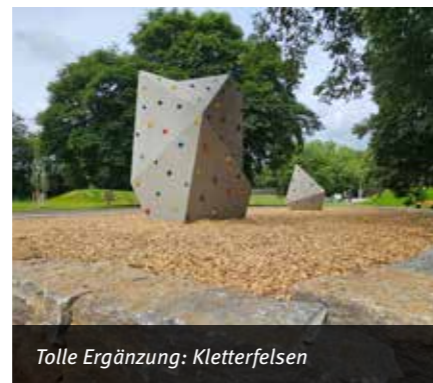
Tolle Ergänzung: Kletterfelsen