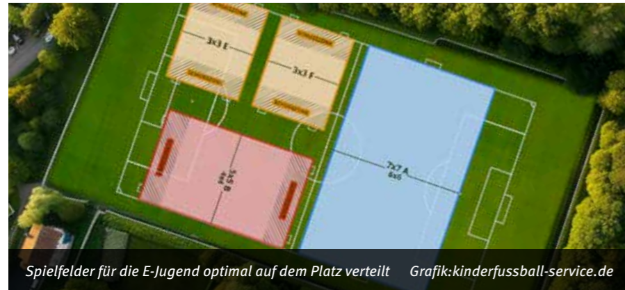
Spielfelder für die E-Jugend optimal auf dem Platz verteilt Grafik:kinderfussball-service.de

Reform weckt und fördert Talente über Spaß am Spiel