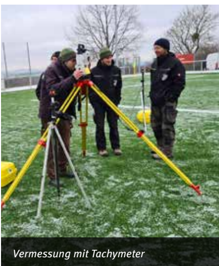
Vermessung mit Tachymeter