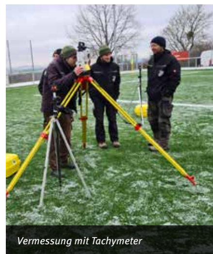
Vermessung mit Tachymeter

Wir helfen Ihnen bei der Umsetzung der neuen Spielformen im Kinderfußball